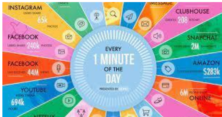
Figura N° 2: "Un minuto en Internet" en "Infographic Data Never Sleeps 8.0"

En el corazón de la actividad digital del mundo se encuentran los servicios y aplicaciones cotidianos que se han convertido en elementos básicos de nuestras vidas. En conjunto, estos producen cantidades inimaginables de actividad del usuario y datos asociados.