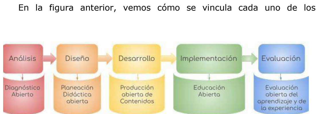
Figura 1. Prácticas Educativas Abiertas mediante Modelo ADDIE.

componentes de las prácticas educativas abiertas en el Modelo ADDIE.